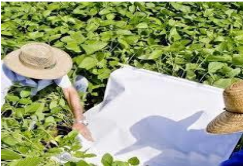
Figura 5. Monitoramento pano de batida.

Pesquisas apresentadas nas Comissões Nacionais de Soja durante a década de 80 levaram às seguintes recomendações: o controle deve ser iniciado quando forem encontrados quatro percevejos adultos ou ninfas com mais de 0,5 cm, por batida de pano (2 m lineares de fileira de plantas/ batida de pano) e, para o caso de campos de produção de sementes, este nível deve ser reduzido para dois percevejos/ batida de pano (DeGRANDE e VIVIAN, 2007).