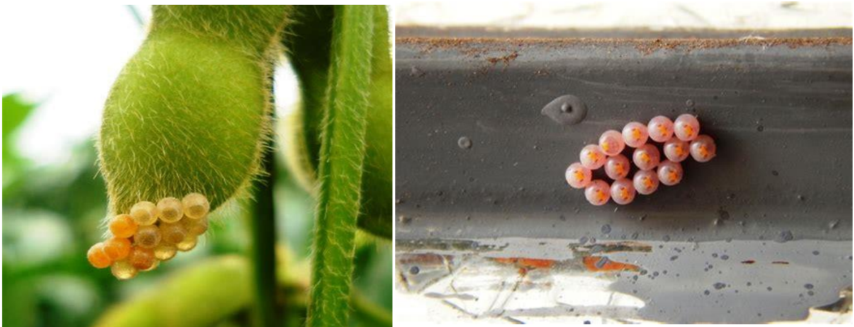
Figura 1. a) Ovos recém depositados com coloração bege. b) Ovos com coloração rosácea, apresentando a fase final do desenvolvimento do embrião (prestes a eclosão das ninfas).

Segundo estudos realizados por MOREIRA e ARAGÃO (2009), as fêmeas depositam os ovos nas folhas e vagens. Eles são depositados em pequenos grupos normalmente com 6 a 15 ovos e em fileiras, geralmente duas ou três. No início, os ovos são bege (Fig. 1 a) e, de acordo com o desenvolvimento do embrião, adquirem coloração rósea (Fig. 1 b).