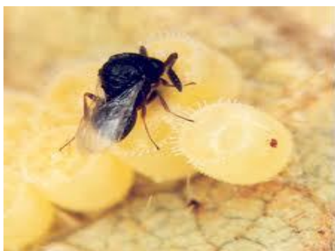
Figura 5. Vespa adulta de Trissolcus basal s

O uso do parasitoide Trissolcus basal s, pertencente a ordem Hymenoptera e família Platygasteridae, para o controle de percevejo marrom Euschistus heros , trata-se de uma vespa da cor preta, com comprimento de aproximadamente 1mm (Fig.5). Os adultos têm vida livre e depositam seus ovos no interior dos percevejos matando o embrião, onde se desenvolvem até a fase adulta, quando então emerge o parasitoide do ovo do percevejo (BUENO, 2012).