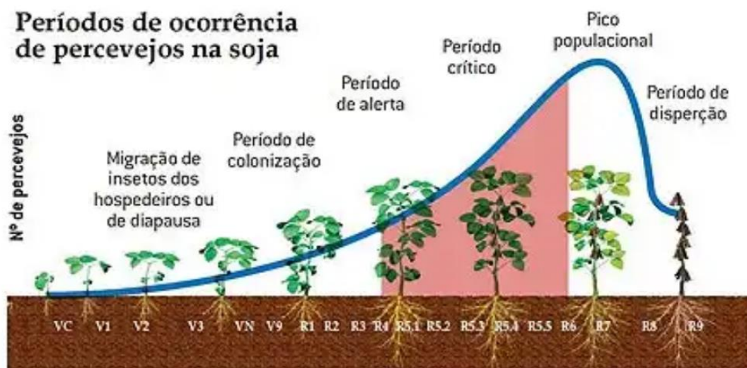
Figura 4. Período de ocorrência dos percevejos na soja.

O percevejo marrom coloniza a soja no final do período vegetativo (V6 e V8), quando sai da diapausa, com isso a população do inseto-praga tende a crescer e provoca danos no período de enchimento de grãos (R4 e R6), causa danos na sua forma jovem entre o terceiro e quinto instar (Fig. 4) (RIBEIRO, 2017).