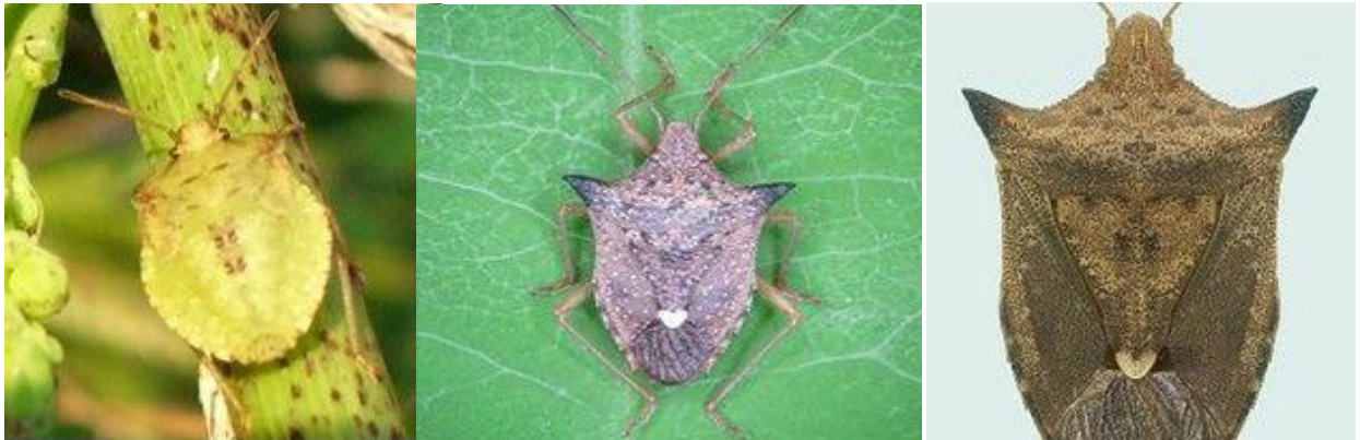
Figura 2. a) Ninfa do percevejo marrom. b) Adulto do percevejo marrom. c) Detalhes das asas e do escutelo com chifres laterais.

O ciclo biológico, do ovo ao adulto, dura aproximadamente 40 dias. Durante seu desenvolvimento as ninfas passam por cinco estádios, as recém eclodidas também apresentam habito gregário, permanecendo reunidas em colônias e não causando danos a cultura. A partir do terceiro instar passam a sugar os grãos da soja.