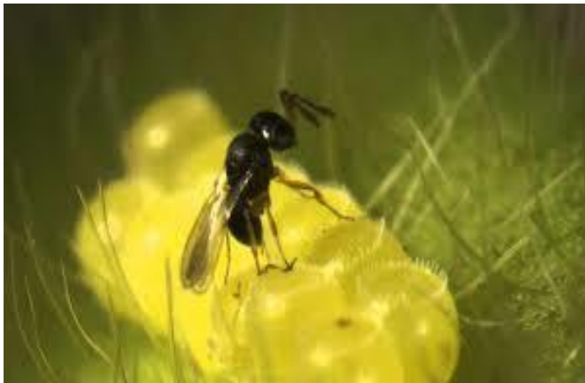
Figura 6. Vespa adulta de Telenomus podisi .

O parasitoide Telenomus podisi da ordem Hymenoptera, vive cerca de um mês em campo, mas parasita quase 80% dos ovos dos percevejos até duas semanas após a emergência. Os primeiros ovos parasitados dão origem a mais fêmeas e depois passa a produzir mais machos, mas a razão sexual fica ao redor de 0,6 portanto, produz mais fêmeas que machos. Uma fêmea parasita, em média 210 ovos de E. heros . Um ovo parasitado leva cerca de duas semanas para dar origem a novos adultos (PINTO, 2015).