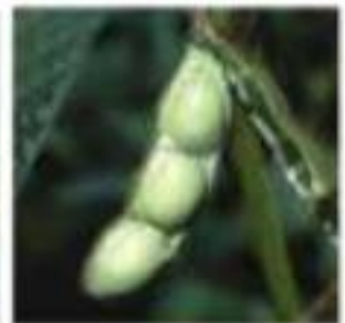
Figura 3. a) Semetes danificadas por percevejos. b) Estádios fenológicos da soja mais suscetíveis aos danos dos percevejos.