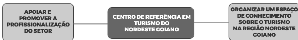
Figura 1: Macro-objetivos do CRETUR.

O CRETUR tem suas ações estruturadas em dois macro-objetivos, conforme mostra a Figura 1.